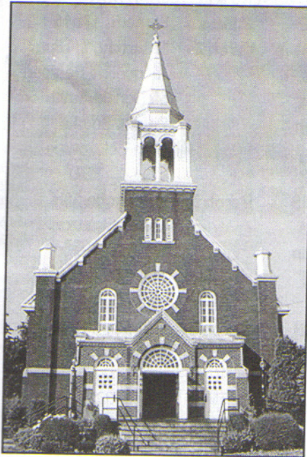
Construit en / Built in 1896 Rénové en / Renovated in 1920