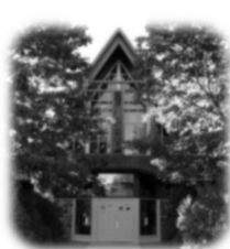
Église Saint-Pierre 87, chemin du Fleuve, Pointe-des-Cascades