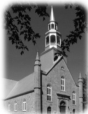
Église Saint-Michel 414, Saint-Charles, Vaudreuil-Dorion

9 DÉCEMBRE 2018 – 2 E DIMANCHE DE L'AVENT