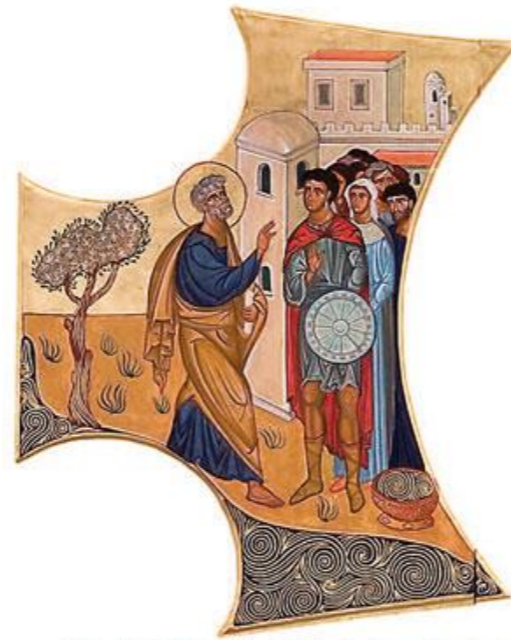
© Croix de l'Esprit Saint, Diocèse de Balley-Ars, France ; réalisation de Kaspars Pīkars, Communauté du Chemin Neuf, abbaye des Dombes.

Que la grâce du Jubilé, qui fait de nous des Pèlerins d'espérance , ravive en nous l'aspiration aux biens célestes et répande sur le monde entier la joie et la paix de notre Rédempteur. A toi, Dieu béni dans l'éternité, la louange et la gloire pour les siècles des siècles. Amen