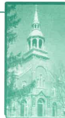
Communauté Saint-Télesphore 1876