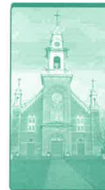
Communauté Saint-Polycarpe 1834