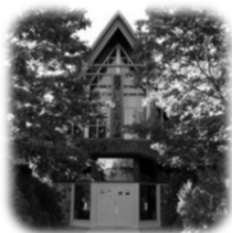
Église Saint-Pierre 87, chemin du Fleuve, Pointe-des-Cascades