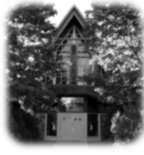
Église Saint-Pierre 87, chemin du Fleuve, Pointe-des-Cascades