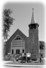
Église Très-Sainte-Trinité 145, Saint-Charles Vaudreuil-Dorion