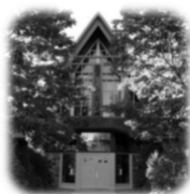
Église Saint-Pierre 87, chemin du Fleuve, Pointe-des-Cascades