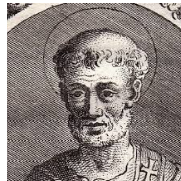
Fête: 17 avril

http://www.cassicia.com/FR/Vie-de-saint-Anicet-ler-pape-et-martyr-Fete-le-17-avril-Pape-de-155-a-166-No_231.htm