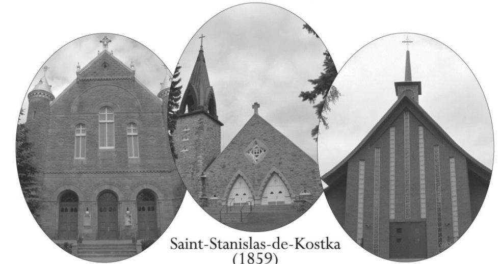
Saint-Anicet (1827) Saint-Stanislas-de-Kostka (1859) Sainte-Barbe (1882)