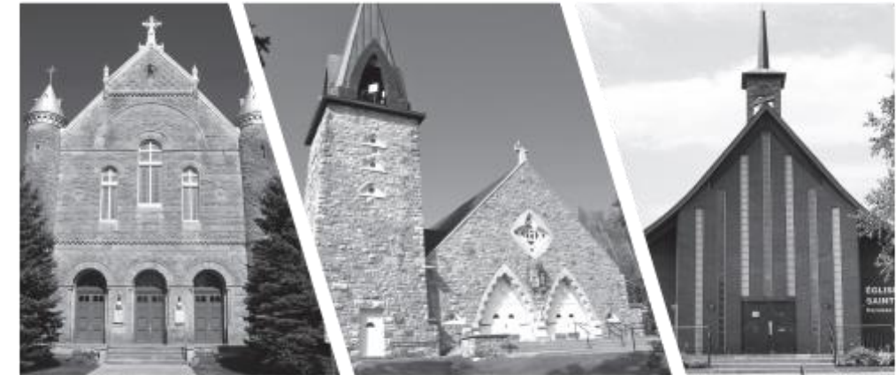
Saint-Anicet 1827 Saint-Stanislas-Kostka 1859 Sainte-Barbe 1882