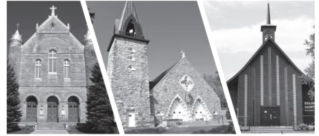
Saint-Anicet 1827 Saint-Stanislas-Kostka 1859 Sainte-Barbe 1882