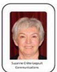
Suzanne Côté-Lepout Communications